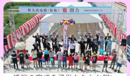
橋桁の完成を子供たちとお祝い