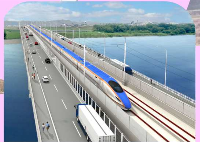
全国初!!新幹線と道路の下部工一体型の併用橋