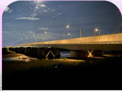
魚類に影響が出ないように川面に明かりが漏れにくい照明