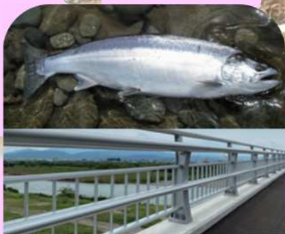
サクラマスイメージしたシルバー色で統一されたデザイン