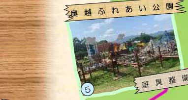
奥越ふれあい公園