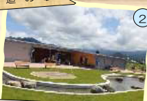
恐竜渓谷かつやま